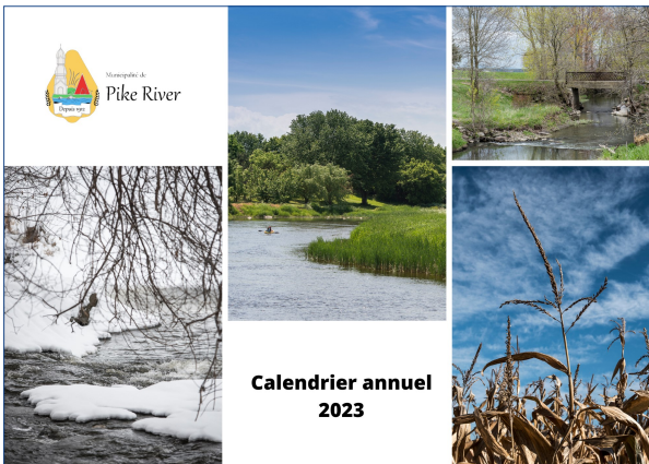
Calendrier annuel 2023

La création du calendrier 2023 va bon train.